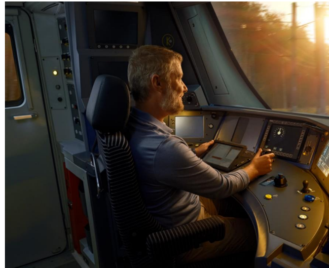
Répartir la capacité