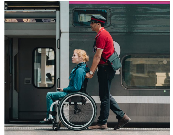
Augmenter la capacité