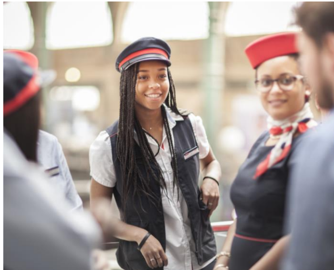
Qualité de service